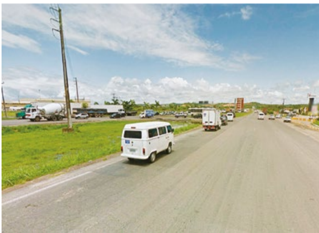
Retorno em frente à Vitarella será redirecionado para Comportas.

O projeto de recuperação já está pronto e foi encomendado pela Cone S/A à JBR Engenharia, que avaliou as melhorias possíveis na mobilidade da BR-101 Sul e indicou as obras necessárias. O estudo foi doado pela empresa ao Governo do Estado para facilitar e acelerar sua execução.