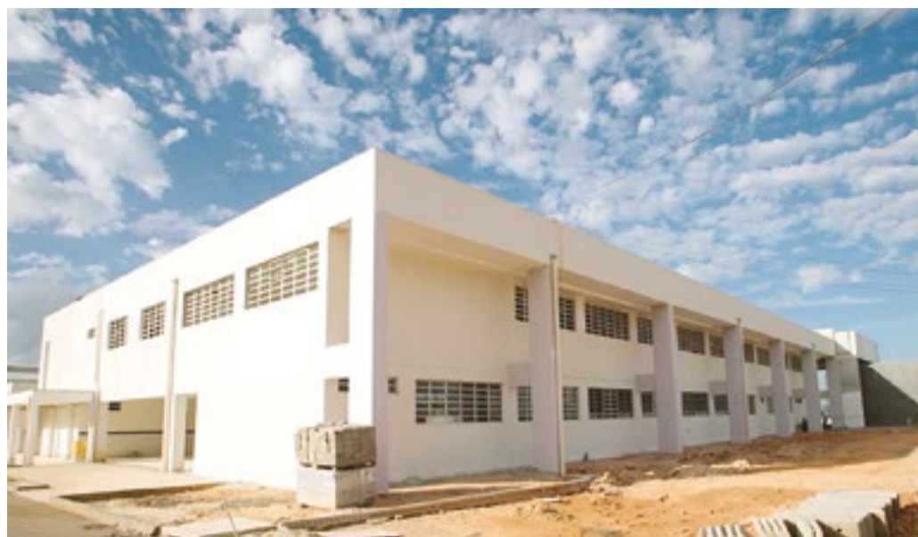
Nova escola técnica deve estar finalizada em abril.

A ETE do Jordão faz parte de um conjunto de 13 novas escolas técnicas que estão em construção pelo Governo de Pernambuco. Quando forem concluídas, ainda em 2015, as unidades aumentarão o número de escolas técnicas em funcionamento no Estado, de 27 para 40, o que resultará na ampliação da oferta de vagas no ensino profissionalizante. Hoje, as ETEs já existentes atendem a cerca de 16 mil alunos, nas modalidades integrada e subsequente, com uma oferta de 33 cursos.