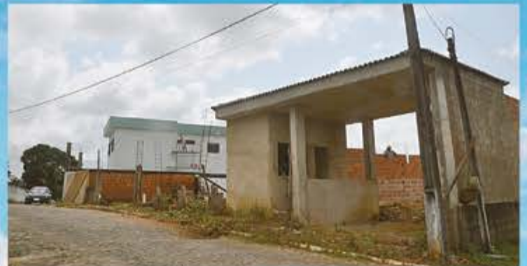
Segurança que você merece