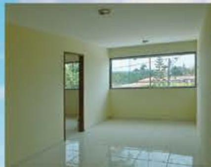
Salas panorâmicas e ventiladas