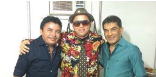
Com Os Nonatos